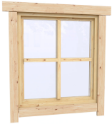
0.87×0.78 м.1 шт.