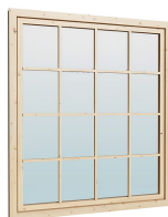
1.62×1.885 м.1 шт.