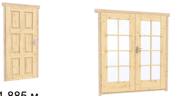
0.84×1.885 м. Межк. 3 шт. 1.62×1.885 м. 1 шт.

7. Наличники: сухая строганная доска 20×100 мм.;