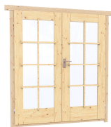
1.62×1.885 м.1 шт.

7. Наличники: сухая строганная доска 20×100 мм.;